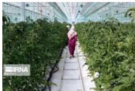
گلستان رتبه چهارم کشوری در ایجاد گلخانه

مدیرعامل شرکت شهرک های کشاورزی سازمان جهادکشاورزی گلستان گفت: شتاب در ایجاد زیرساخت های شهرک های کشاورزی استان، به همکاری بیش از گذشته دستگاه های مرتبط از جمله در حوزه رفع معارض محلی اراضی و تسریع در پرداخت تسهیلات به متقاضیان علاقمند توسط بانک های عامل نیاز دارد.