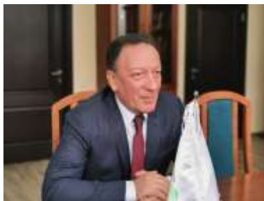
آرکادی زلوچیفسکی رئیس اتحادیه غلات روسیه

مسکو - ایرنا - بر اساس تصمیم اتحادیه غلات روسیه، از این پس تولیدکننده‌های معتبر غلات این کشور بطور مستقیم با واردکنندگان ایرانی ارتباط برقرار می‌کنند و این عرصه تجاری سر و سامان بیشتری خواهد یافت.