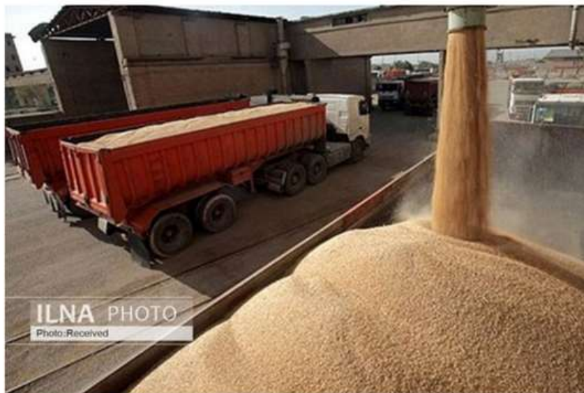
ILNA PHOTO Photo: Received