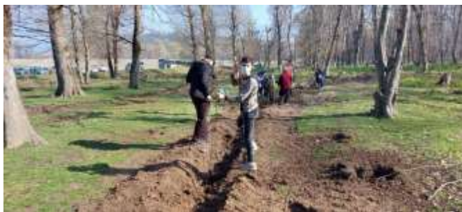
کاشت نهال در جنگل قرن آباد گرگان

گرگان- ایرنا- مدیرکل منابع طبیعی و آبخیزداری گلستان گفت: توجه بیشتر دولت و نمایندگان مجلس شورای اسلامی برای تخصیص اعتبار موردنیاز با هدف احیای جنگل‌های این استان ضروری است.