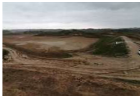
آب بندان خشک آق تقه مرواه تپه

به گفته قربانی، دشت تفر که در زبان محلی معنی "خشک و لم یزرع" می دهد، دشتی وسیع بین ۲ روستای مرزی "آق تقای و نارلی آجی سو" قرار دارد.