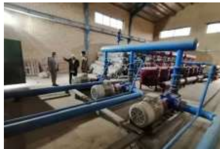
تاسیسات بلا استفاده ایستگاه پمپاژ آق تقه مراوه تپه

قربانی اضافه کرد: در راستای استفاده از مزایای ایستگاه پمپاژ احداث شده توسط کشاورزان، هم اکنون در ۳۰۰ هکتار از اراضی دشت تقر سیستم آبیاری قطره ای احداث و در ۵۰ هکتار دیگر نهال درختان مثمر غرس شده است اما به سبب تکمیل نشدن پروژه و نیاز به تعمیر داشتن موتور پمپها، بلا استفاده مانده و بند خاکی نیز در حال خشک شدن است.