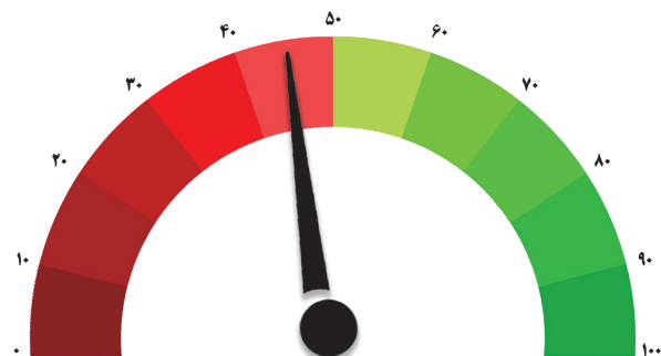
شامخ صنعت - دوره بیست و ششم