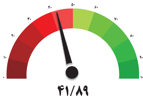
شاخص کل اقتصاد – دوره چهارم