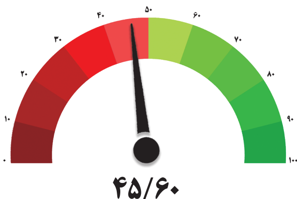
شاخص صنعت – دوره پنجاه و دوم

مرکز آمار و اطلاعات اقتصادی و پایش اصل ۴۴