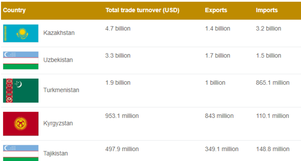
جدول ۱- تجارت ترکیه با منطقه آسیای مرکزی از ژانویه تا نوامبر ۲۰۲۲

به طور کلی، تخمین زده می‌شود که صادرات ترکیه در سال ۲۰۲۲ به ۲۵۲,۲ میلیارد دلار رسیده است، در حالی که ارزش واردات ترکیه به ۳۶۱,۱ میلیارد دلار رسیده است. بنابراین، تجارت ترکیه با آسیای مرکزی حدود ۲ درصد از کل ترکیه را تشکیل می‌دهد و فضای زیادی برای توسعه آن وجود دارد.