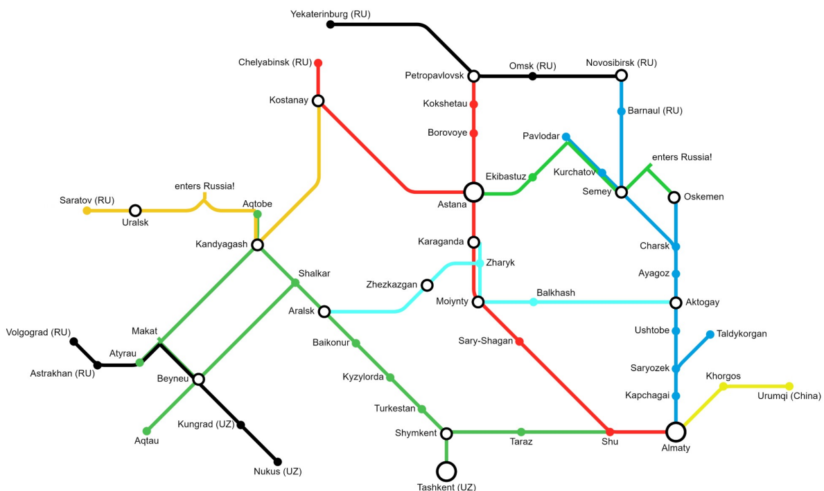
Passenger railway map of Kazakhstan*

در زمینه گسترده‌تر تقویت زیرساخت‌های راه‌آهن قزاقستان، تلاش‌هایی برای ساخت خطوط دوم در بخش راه‌آهن Dostyk-Moiynty در حال انجام است. همزمان، طرح‌هایی برای خطوط راه‌آهن بختی-ایاغوز و دربازا-مکتارال در حال انجام است که مجموعاً بیش از ۱,۳۰۰ کیلومتر بر طول خطوط راه‌آهن قزاقستان طی سه سال آینده می‌افزاید. ایستگاه آلماتی در نقشه ذیل در قسمت پایین سمت راست قابل مشاهده است. این ایستگاه راه‌آهن قزاقستان را به منطقه قورغاص به عنوان مهمترین منطقه ویژه اقتصادی چین-قزاقستان و به اورومچی مرکز سین کیانگ چین متصل می‌کند. ایستگاه آلماتی مهمترین هاب مسیرهای ریلی ابتکار کمربند و راه در خارج از چین محسوب می‌شود.