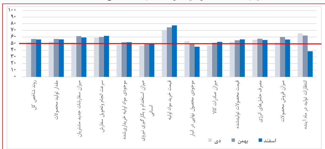
نمودار ۳: مقایسه شاخص‌های بخش صنعت در سه ماه منتهی به اسفند ۱۴۰۲