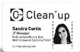
Maximum width of the color-printed area: 35 mm