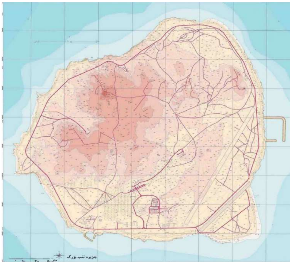
نقشه ۴: جزیره تنب بزرگ

جزیره تنب بزرگ یکی از جزایر ایران و بخشی از شهرستان ابوموسی است که در ۹۷ مایل دریایی معادل ۱۷۹٫۶ کیلومتری از جنوب غربی شهر بندرعباس مرکز استان هرمزگان قرار دارد. این جزیره از شمال با ساحل جزیره قشم حدود ۲۹ کیلومتر، از شمال غربی با شهر بندرلنگه با ۵۱ کیلومتر، از غرب با معادل ۱۳ کیلومتر از جزیره تنب کوچک و از جنوب غربی ۵۳ کیلومتر از جزیره ابوموسی فاصله دارد. فاصله این جزیره تا بندر شارجه در امارات متحده عربی ۱۰۰ کیلومتر ۱ است. مساحت این جزیره نیز حدود ۱۰٫۵ کیلومتر مربع است.